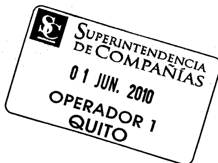
Rocío Martínez SC-RNAE 649