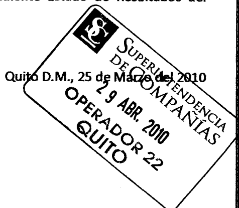
Norma Mantilla REG. 05906