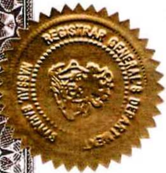
Acting Registrar General

Given under my hand and seal at Nassau in the Commonwealth of The Bahamas this 8th day of March, 2019