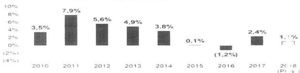
% Evolución del Crecimiento Anual del PIB Real del Ecuador 2010-2018

De una economía que creció al 2.4% real en el 2017 se estima que apenas creció 1.1% inferior al crecimiento poblacional de 1.5%. Consecuentemente, el nivel de ingresos per cápita del país también se redujo.