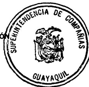
AB. VÍCTOR GRANADOS LARREA DIRECTOR NACIONAL DE ACTOS SOCIETARIOS Y DISOLUCIÓN