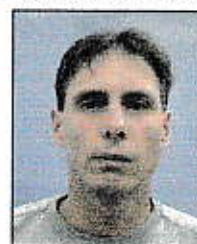
Foto registrada en la DIGERCIC