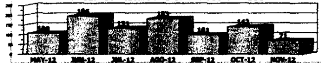
Consumos facturados en metros cúbicos

¡TENGA MUCHO CUIDADO! INTERAGUA NO ENVÍA PERSONAL A SU DOMICILIO PARA COBRAR VALOR ALGUNO, NO SE DEJE ENGAÑAR. PARA SU TRANQUILIDAD CANCELE SÓLO EN LAS VENTANILLAS DE LAS INSTITUCIONES AUTORIZADAS, LAS CUALES ESTÁN DETALLADAS AL REVERSO DE ESTA FACTURA.