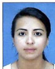
Foto registrada en la DIGERCIC