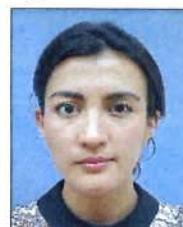
Foto registrada en la DIGERCIC