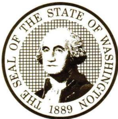
Kim Wyman, Secretary of State

Given under my hand and the Seal of the State of Washington at Olympia, the State Capital