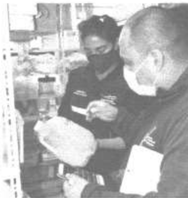
SITUACIÓN. La Policía Nacional y la Intendencia de Salud de Santo Domingo de los Tsáchilas, en un operativo conjunto, decomisaron 2.250 mascarillas tipo KN95 y 350 pruebas rápidas de Covid-19 que no contaban con registro sanitario.

Participaron de esta labor representantes de la Agencia Nacional de Regulación, Control y Vigilancia Sanitaria (Arma), la Agencia de Aseguramiento de la Calidad de los Servicios de Salud y Medicina Propaganda (Aprosa) y la Intendencia de Salud de Santo Domingo de los Tsáchilas.