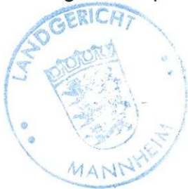
Günter Zöbeley Präsident des Landgerichts

Gebühr KV Nr. 13110 der Anl. z. § 4 Abs. 1 JVKostG in Höhe von 20,00 €