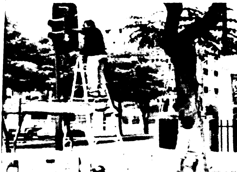
os en varias intersecciones de Portoviejo

La agenda de la jornada se completará con una conferencia sobre el desempeño económico de Ecuador y el modelo de desarrollo en el país andino que el gobernante impartirá ante estudiantes y personalidades del mundo académico de Yale.