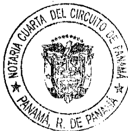
Jaime Eduardo Guillén Anguizola NOTARIO PUBLICO CUARTO

CONCUERDA con su original esta copia que expido, sello y firmo en la ciudad de Panamá, República de Panamá, a los trece (13) días del mes de mayo de dos mil diez (2010).