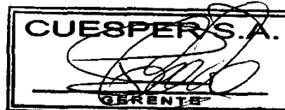
CUESPER S.A. RUC No.1890154057001