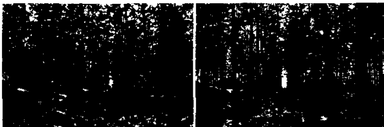
El Tecal - Siembra 2004, Febrero 2013

Las actividades y labores previstas para el año 2012 se cumplieron de acuerdo a lo establecido en el plan anual de actividades. El año comenzó con una temporada invernal de alto nivel de pluviosidad registrándose 2018 mm/año de lluvias desde el mes de Diciembre hasta las primeras semanas de Mayo. Este alto nivel de lluvias es positivo para el crecimiento de la plantación lo cual se refleja en los datos obtenidos de las Parcelas Permanentes de Muestreo.