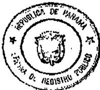
Jefe de Diario

Sección de Mercantil Ficha No. 331464 Sigla No. S.A Documento Redi No 1640673 Operación realizada Acta Derechos de Registro B/. 40.00 Derechos de Calificación B/. 10.00 Panamá 31 de Agosto del 2009 Registrador Jefe